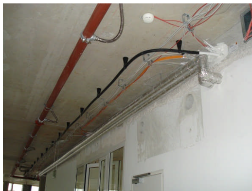
Beispiel einer Leckkabelschleife im Rohbau.

Bei Verlegung von Leckkabeln bzw. Schlitzbandkabeln innerhalb des Objektes ist dieses grundsätzlich als Schleife auszubilden, um im Unterbrechungsfall, zum Beispiel durch Brandeinwirkung oder mechanische Einwirkung, genügend Feldstärke vor Ort sicherzustellen. Alternativ ist eine zweiseitige Einspeisung zulässig. Die