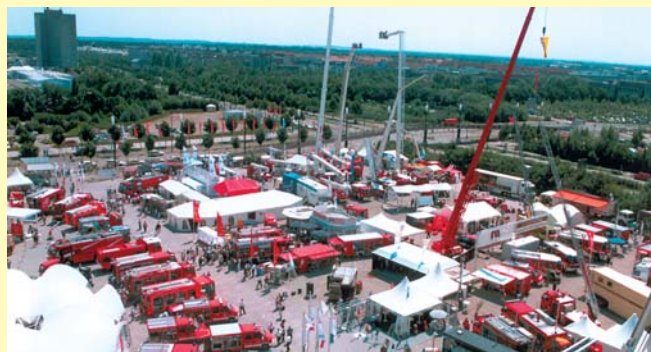
Bild 1 Die letzte INTERSCHUTZ fand im Jahr 2000 in Augsburg statt.

Am Freitag, dem 10. Juni 2005, findet im Convention Center auf dem Messegelände ein Deutscher Feuerwehr-Verbandstag statt, in den die 51. DFV-Delegiertentagung eingebettet ist. Hier sollen vor allem die DFV-Delegierten vom Rahmenprogramm für ihre tägliche Arbeit profitieren. (-sö-)