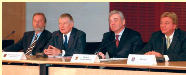
Bild 1 Die Innenminister Fritz Behrens (NRW, v. l.), Otto Schily (Bund), Heribert Rech (BW) und Volker Bouffier (HE) bei der Presse- konferenz im Bundesrat.

Bundesminister Otto Schily hat den Ländern folgende Lösung zur schnellen Einführung des Digitalfunks vorgeschlagen: Der Bund errichtet ein Netz, das 50 % der Fläche der Bundesrepublik Deutschland unter besonderer Berücksichtigung der Ballungsräume abdeckt. Dieses so genannte Rumpfnetz soll dem GAN-Standard (Gemeinsame Anforderungen ans Netz) entsprechen. Die Errichtungs- und Betriebskosten trägt der Bund, die Länder können das Rumpfnetz aber mitnutzen, wenn sie auch die Betriebskosten mittragen. Für die Errichtung der Netzinfrastruktur der anderen Hälfte der Flächenabdeckung müssten die Länder die Kosten tragen. (-sö-)