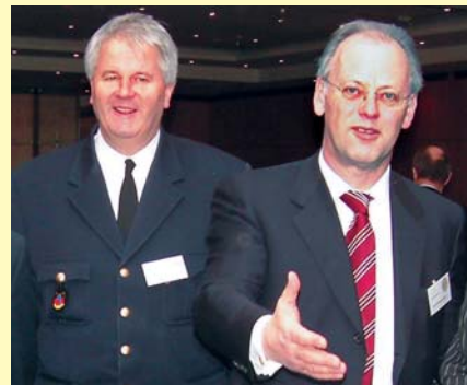
Bild 1 DFV-Vizepräsident Albrecht Broemme (l.) und Bundesminister a. D. Rudolf Scharping referierten beim 3. Nationalen Paging Kongress.

Bundesminister a.D. Rudolf Scharping, der beim Kongress zum Föderalismus referierte, sagte zum Schily-Vorstoß: »Es ist die logische Konsequenz aus der Entwicklung der vergangenen Monate.« Blockaden im Föderalismus könnten nur durch mutige politische Führung überwunden werden. Eine Lösung, die nicht die gesamte Fläche Deutschlands versorge und nur das Bundesinteresse befriedige, sei aber sachfremd. (-sö-)