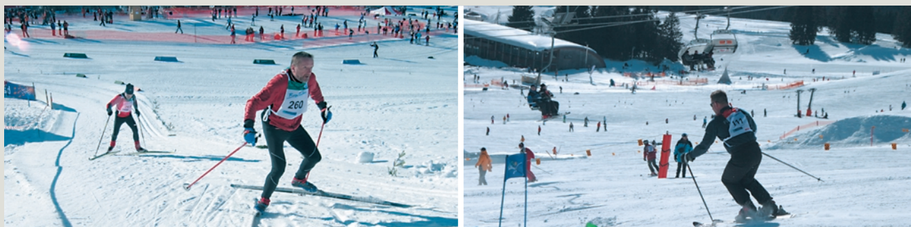
links: Anspruchsvolles Vergnügen: Wer bei den Feuerwehr-Skimeisterschaften vorne mitspielen wollte, musste alles geben. (Fotos: DFV-Presseteam) rechts: Abfahrt vom Feldberg: Beim Riesenslalom herrschten beste Bedingungen und Kaiserwetter.

(Presseteam LFV/DFV: Gaby Klock, Hendrik Roggendorf, Michael Plahusch, Sönke Jacobs)