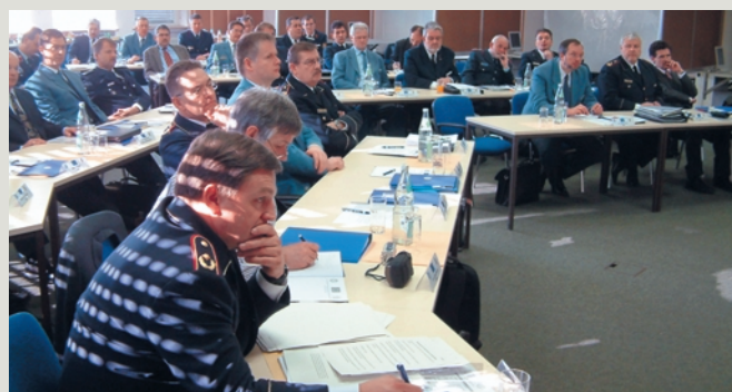
Führungskräfte von Feuerwehren und THW nahmen erstmals an einem gemeinsamen Workshop von DFV und THW teil.