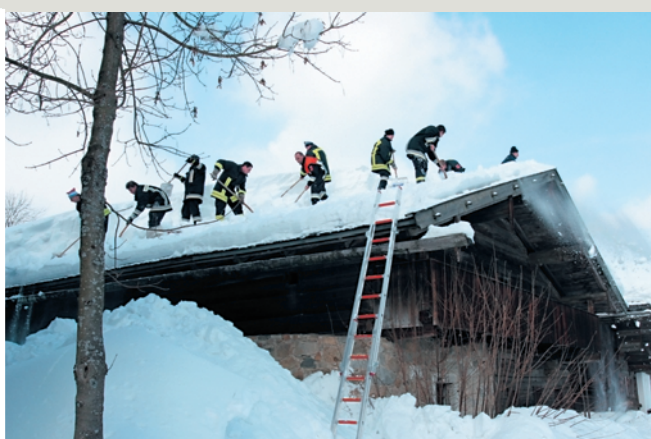
links: Die großen Niederschlagsmengen führten auch zu logistischen Herausforderungen: Bereitstellungsräume wie hier waren Mangelware. rechts: Nicht nur Privathäuser und Firmen waren betroffen – die Feuerwehr half auch im Museumsdorf Bayerischer Wald.

Weinzierl: »Mit einem unvorstellbaren Kraftaufwand haben die Freiwilligen Feuerwehren dafür gesorgt, dass die Schäden für die Kommunen und die vielen Hausbesitzer nicht unermessliche Höhen erreichten. Was hier die Helfer im Interesse und zum Schutz ihrer Mitbürger geleistet ha-