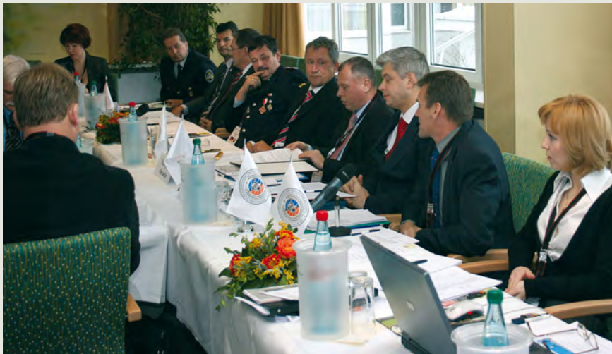
Aus 14 Ländern kamen die Teilnehmer der Konferenz der Sportföderation in Berlin.

Radio 112 sendet als Fachradio 24 Stunden täglich online Musik, Nachrichten und vor allem Informationen rund um die Feuerwehr. »Mittlerweile hören uns täglich mehr als 20 000 Menschen in ganz Deutschland, Österreich und der Schweiz«, berichtet Programmchef Oliver Sachse. Damit gehört der Sender mit dem ehrenamtlichen Team zu den meistgehörten Stationen im Internet. (sda)