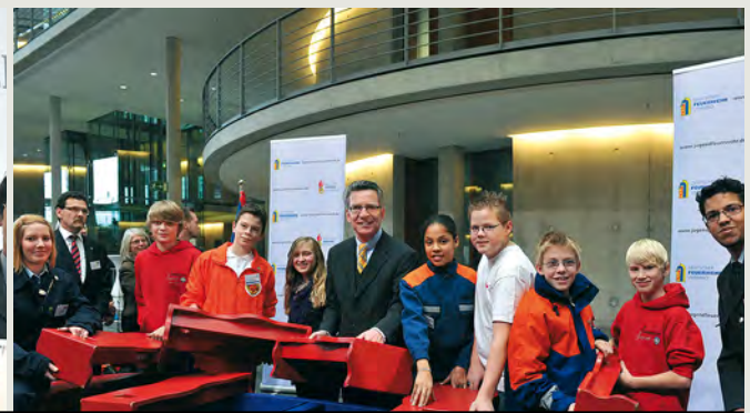
links: Den zweiten Platz der Kategorie »Neue Innovative Konzepte« gab es für die Jugendfeuerwehr im ABC-Zug (Jugendabteilung Feuerwehr Karlsruhe, Baden-Württemberg) rechts: Dr. Thomas de Maizière, Bundesminister des Innern, baute mit jungen Angehörigen der Feuerwehr sowie anderer Hilfeleistungsorganisationen bei der Verleihung des Förderpreises »Helfende Hand 2010« die »Brücke der Integration«