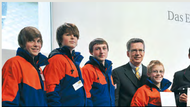
rechts: Radio 112 (Rendsburg, Schleswig-Holstein) belegte mit dem Feuerwehr-Radio im Internet den ersten Platz der Kategorie »Neue Innovative Konzepte« des BMI-Förderpreises »Helfende Hand«.