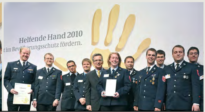
links: Jugendliche Teilnehmer des Projekts »Hilfe zur Selbsthilfe« – Brandschutz und Erste Hilfe der Claus-von-Stauffenberg-Schule in Rodgau (Kreis Offenbach, Hessen), die in der Kategorie »Nachwuchs- und Jugendarbeit« den ersten Platz belegten.