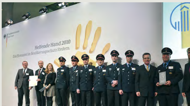
rechts: Das Projekt »Retten kann jeder! ... bei uns lernen« des Kreisjugendfeuerwehrverbandes Aichach-Friedberg (Bayern) kam auf den zweiten Platz der Kategorie »Nachwuchs- und Jugendarbeit«