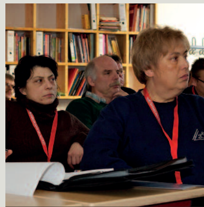
Konzentrierte Mitarbeit in den 23 Workshops des Forums Brandschutzerziehung und -aufklärung in der Christianischule in Lüneburg.