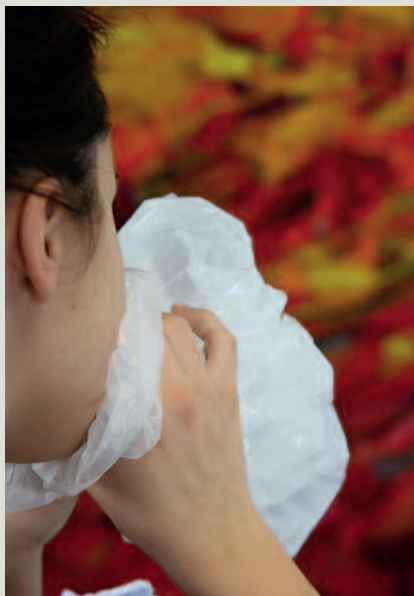
Die Rückatmung in eine Tüte kann zur Normalisierung des CO 2 -Wertes genutzt werden.

Auslöser eines Hyperventilationssyndroms sind oft Angst, Erregungszustände oder be-