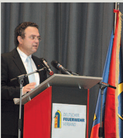
Bundesinnenminister Dr. Hans-Peter Friedrich avisierte für 2012 die Auslieferung von weiteren 80 LF- Kats.

Eine Verzögerung musste Friedrich jedoch für die geplanten Schlauchwagen ankündigen: »Ich befürchte, dass wir diese neu ausschreiben müssen«, erklärte er den knapp 200 Delegierten und zahlreichen Gästen aus Politik, Wirtschaft und Verband. Als praktisches Beispiel im Bereich der Beschaffungen für den Katastrophenschutz im Zivilschutz stellte das Bundesamt für Bevölkerungsschutz und Katastrophenhilfe den Besuchern des Verbandstages die Projekt-