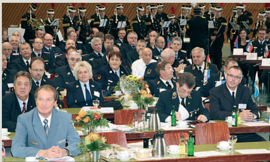
Delegiertenversammlung mit landsmannschaftlichen Klängen: Die Bergmannskapelle St. Ingbert (hinten) begleitete die Veranstaltung.