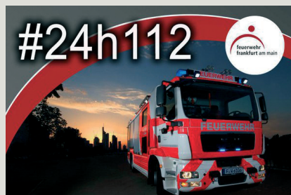
Die Feuerwehr Frankfurt am Main twitterte 24 Stunden live (Screenshot).

Die genannten Kanäle werden von den Befragten überwiegend für Berichte über Einsätze genutzt. Abfallend folgen die hauptamtliche Nachwuchswerbung, Kampagnen, Verbreitung von eigenem Text-, Bild- und Bewegtbildmaterial, ehrenamtliche Nachwuchswerbung, Erhöhung der