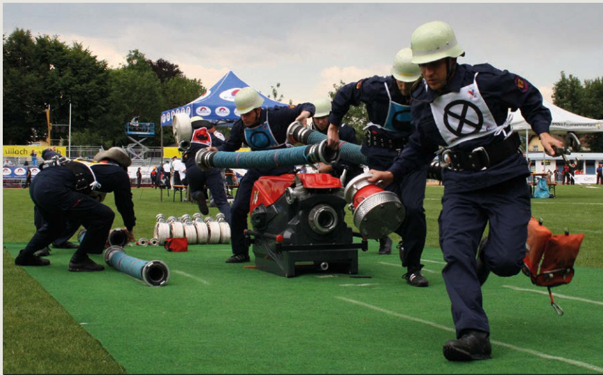
Da fliegen die Leinenbeutel: Nidderau-Eichen beim Löschangriff im Traditionellen Wettbewerb

Im Internationalen Feuerwehr-Sportwettkampf sicherten sich die Männer aus dem Team Lausitz in der Gesamtwertung aus 100-Meter-Hindernislauf, Löschangriff nass, 4 x 100-Meter-Hindernis-Staffel und Hakenleiter Gold. Im Löschangriff nass begeisterte das Team Märkisch-Oderland mit der Gold-Zeit von 00:24,22 Sekunden. Im Traditionellen Internationalen Feuerwehrwettbewerb gab es Goldmedaillen für die Gruppen Herrenberg-Kuppigen (BW), Renningen (BW) und Nidderau-Eichen (HE) (alle Männer A), Langenbach (RP) (Männer B) sowie Nidderau-Eichen (HE) (Frauen A).