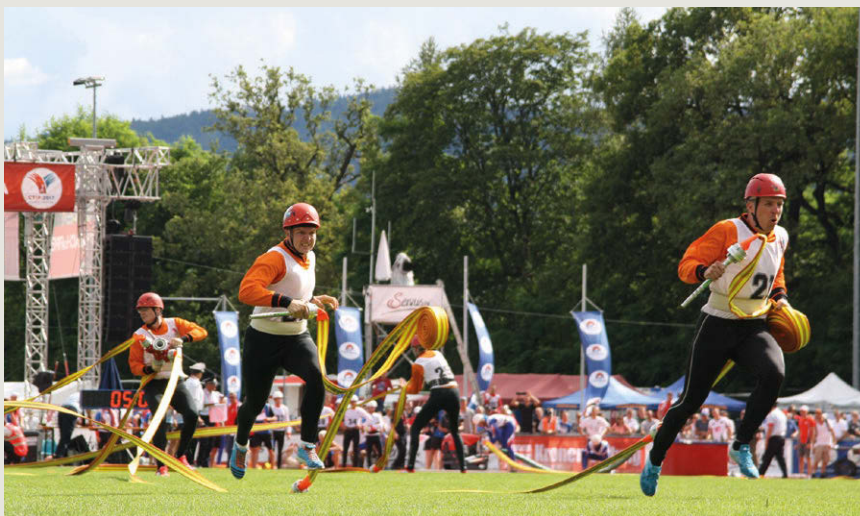
Mit dem Wasser um die Wette rennt das Team Märkisch-Oderland beim Löschangriff nass.