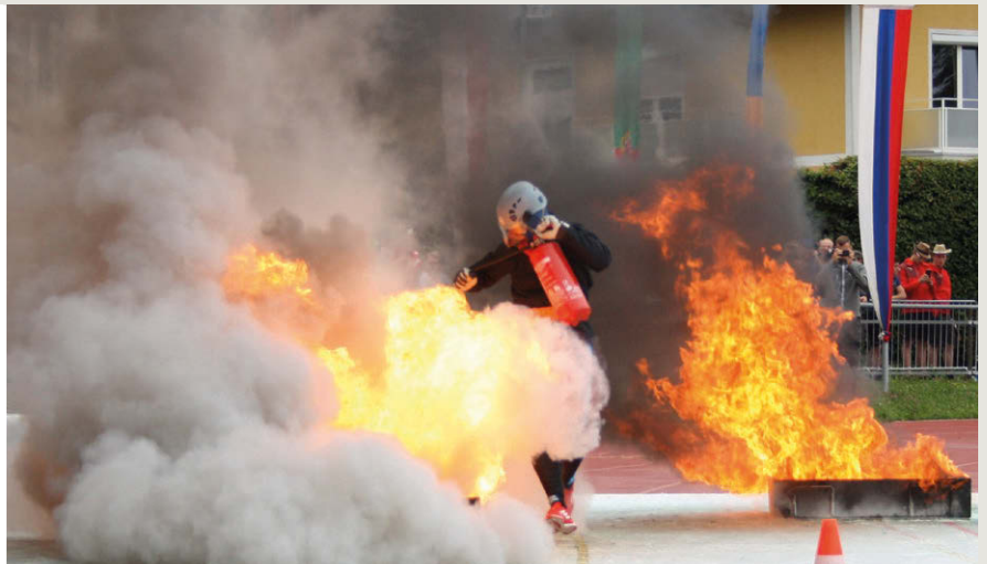
links: Im Feuerwehrsport klettern die Teilnehmer im vollen Lauf mit der Leiter aufs Haus. (Foto: S. Darmstädter) rechts: Heiß her geht's bei der 4 × 100-m-Staffel im Team Lausitz. (Foto: S. Darmstädter)