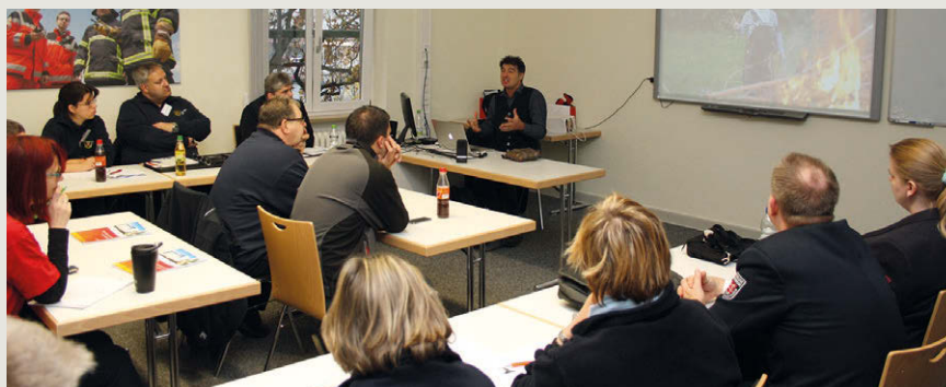
Das Forum Brandschutzerziehung bietet spannende Vorträge aus der Praxis.

Erstmals ist vor Ort eine Kinderbetreuung möglich: Während der Tagungszeiten bietet der Kinder- und Erholungszentrum Frauensee ein Programm für Kinder ab sechs Jahren an. Die Anmeldung für die Kinderbetreuung erfolgt per E-Mail unter floriansdorf@frauensee.de . Die Teilnehmerzahl ist beschränkt und erfolgt nach dem Zeitpunkt der Anmeldung. (sda)