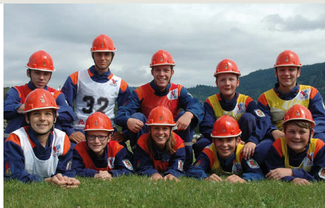
links: Dank für langjährige Verbundenheit: DFV-Auszeichnungen beim Bewerterabend rechts: Die Jugendgruppe aus Heldenstein zeigte Begeisterung und Zusammenhalt.

der nach einem Unfall im Einsatz querschnittsgelähmt ist, fuhr gemeinsam mit dem Abfahrts-Olympiasieger und ehrenamtlichem Feuerwehrmann Fritz Strobl im Rettungskorb einer Drehleiter mit der olympischen Fackel hinauf zum Feuer. Währenddessen gedachten Athleten und Zuschauer allen Feuerwehrangehörigen,