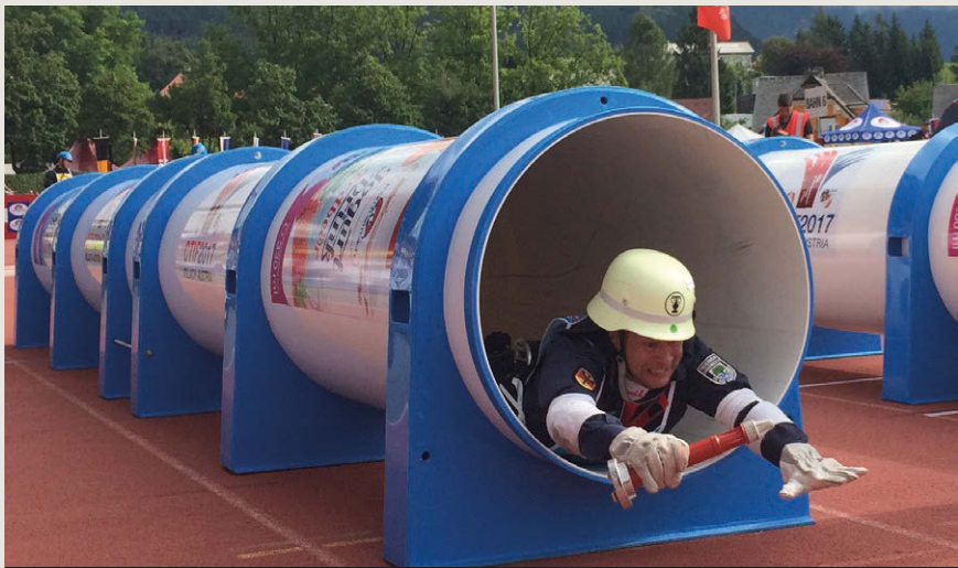
Flink durch die Röhre (oben, Feuerwehr Langenbach) und über die Hürde (unten, Feuerwehr Huttengrund).