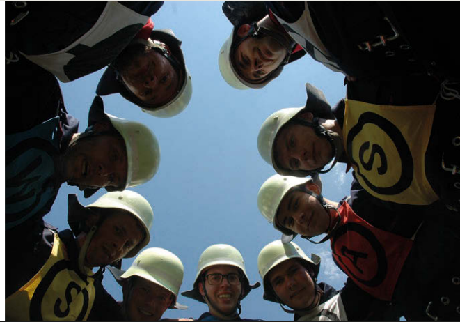
links: Das sind die Lausitzer Jungs: Silber im 4 × 100-m-Lauf! rechts: Perspektivwechsel: das Suhler Feuerwehrteam